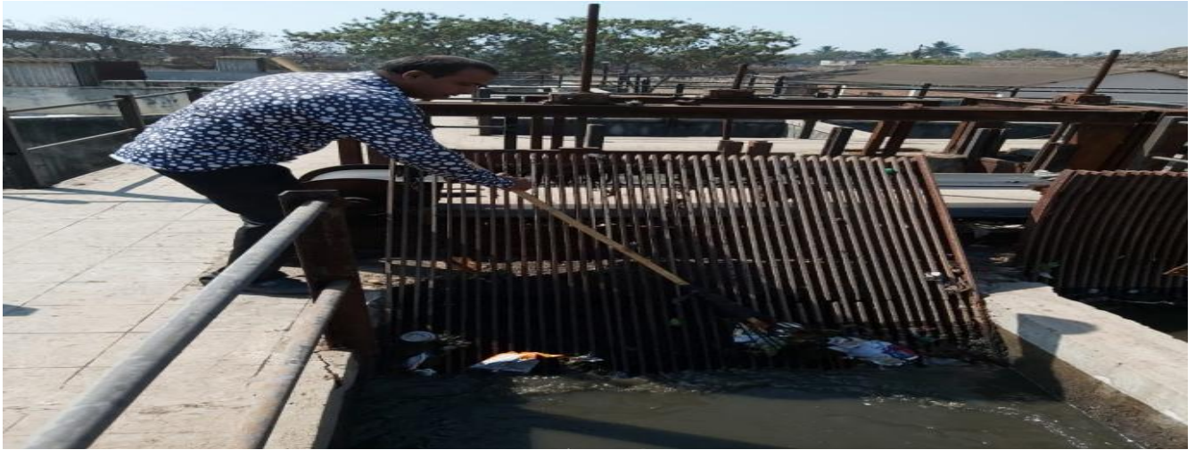
Screens @ Ichalkaranji Solid Waste Composting @ Ichalkaranji